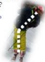
このくらいの傾が！

皆さんはターンをする時に、スキーのどの部分に圧をかける感覚ですか？【2】【3】に赤丸6か所で部位をします。いつも自分の抑えているところを指定してください、そしてそこを抑えた時に、①～⑦の答えと会う部分がありますか？宿題です！答えはこの次にニュースがなくなったらです！