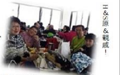
Y&S原 & 親戚！

3月29日(日)好天に恵まれた ハイランド例会。参加者は、Y/M・ S/S・O/H・S/K・H/N・Hさんの いとこ・孫・Y/Uのフレンド0名と スカディの3名、計11名でした。