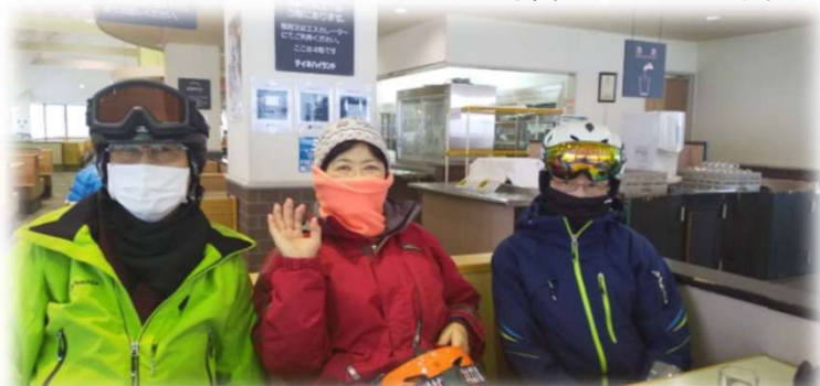
元気なA・SさんとW・SさんとS・Aさん