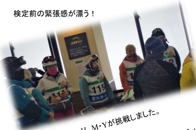
O・H、M・Yが挑戦しました。