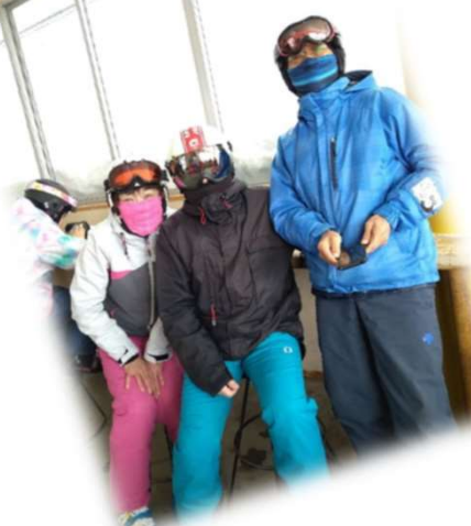
O・Hさんと久しぶりのO・AさんとS・Sさんです。