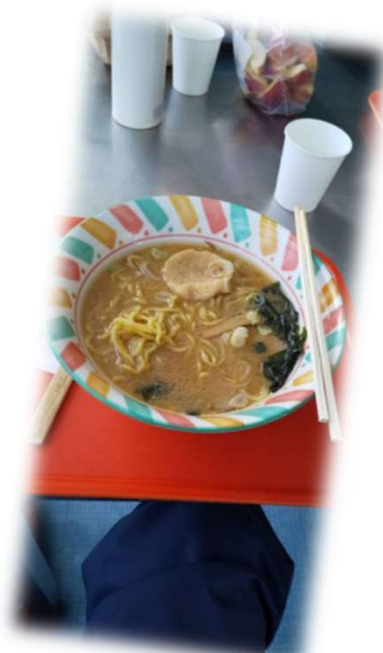
アサリの入っていない朝里ラーメン！