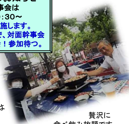
贅沢に食べ飲み放題です。