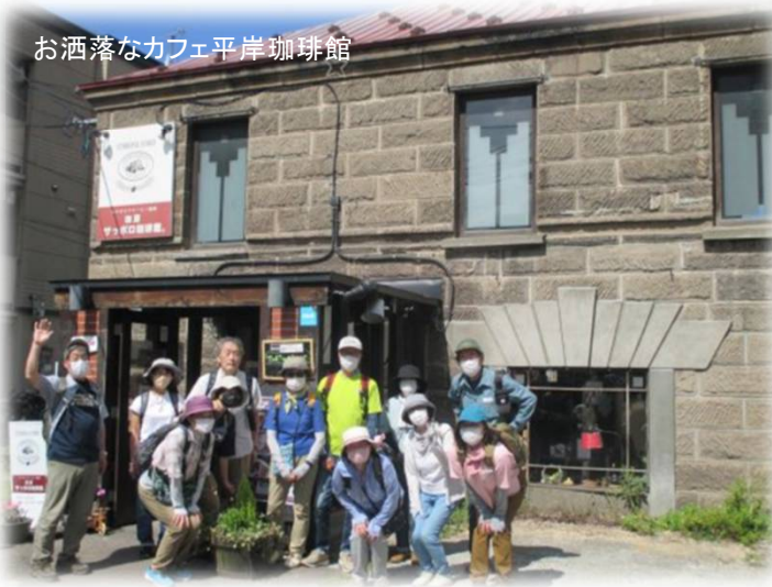
お洒落なカフェ平岸珈琲館