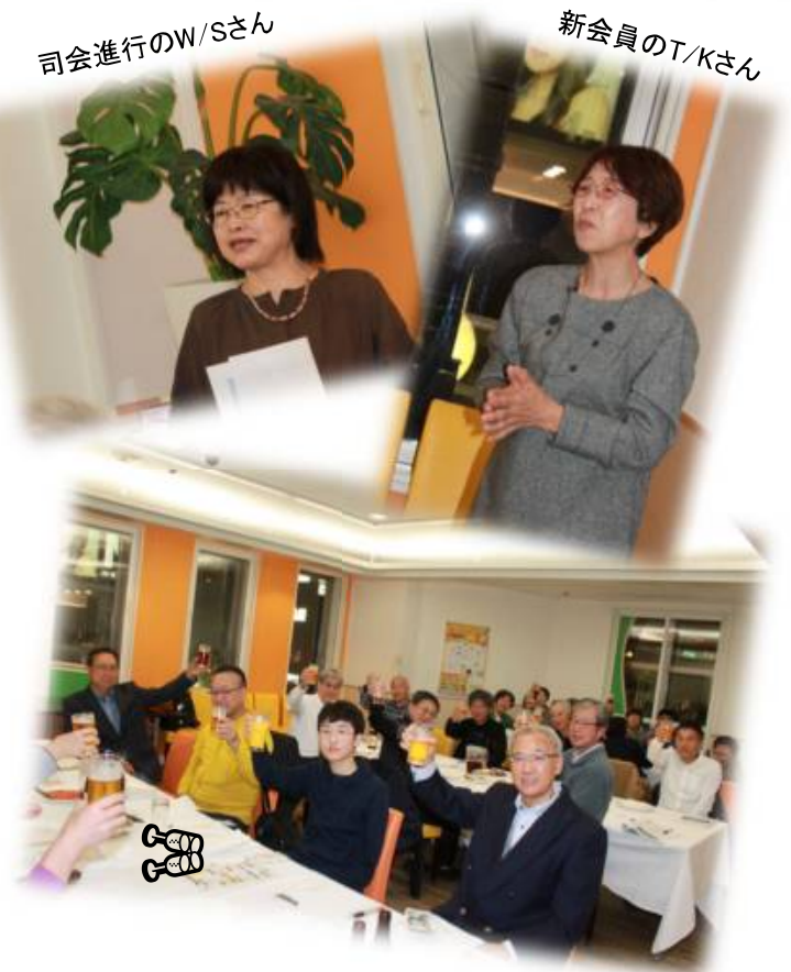
S/Nさんが 元気に参加です！