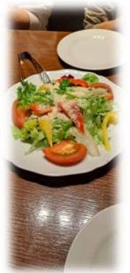
Wが見えない？ 赤レンガかな？

総会が終わりニュース担当は何かするか！ と、考えた結果、紙面を変えてみることに。 ただし印刷はB4を変えない、添付PDFはA4でと考 えた結果こんな感じになりました。皆さんか らのご意見をお待ちします。 今回は総会と気ままに(いいネーミングだなー)と沢 山の例会がありました。12月は少ないかな？皆 さんからの「ちょっとこんな事」が在りましたら連絡を。 総会后、担当のW/Sさんが悩んでいます。議案書のみ、 議案書とニュース、ニュースのみと郵送に3種類、頭 を悩ましてます。