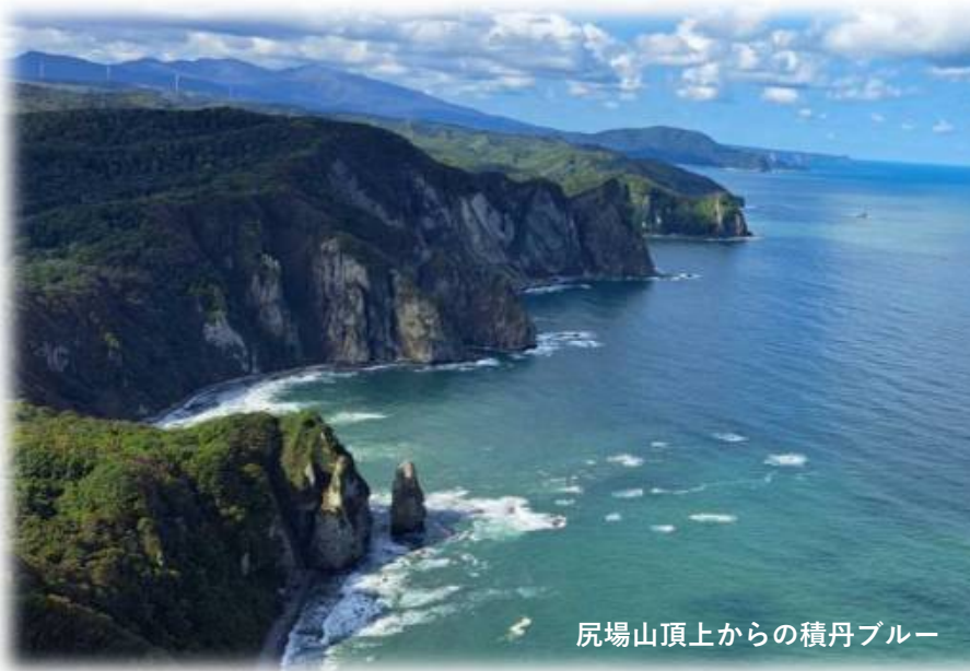
尻場山頂上からの積丹ブルー