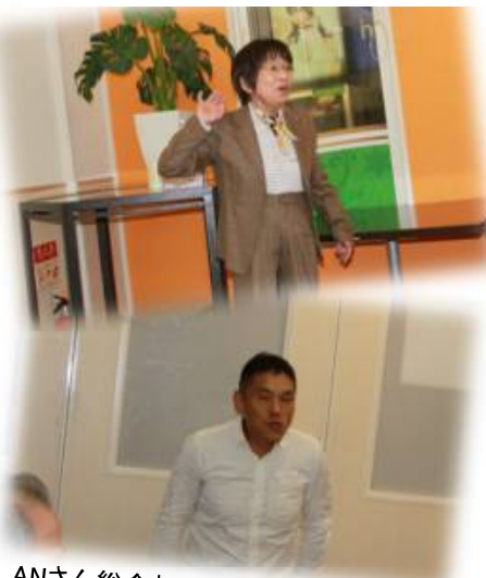
ANさん総会初参加！A/Nさんの滑りを盗むぞー！