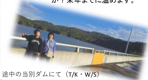
途中の当別ダムにて (T/K・W/S)

会員の方からの要望があり、事前調査にて宮島沼に行ってきました。途中の当別ダムでの一コマです。紅葉はまだでしたが、徐々に南下してます。ピークは10/1頃とか、6万羽くらい、本日は1万羽くらいとか。さて、どんな形で例会が計画されるか楽しみです。早朝か？夕方か？どこに泊まるか？日帰りか？来年までに温めます。