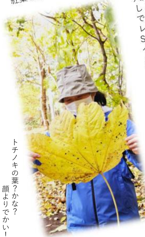
トチノキの葉？かな？ 顔よりでかい！