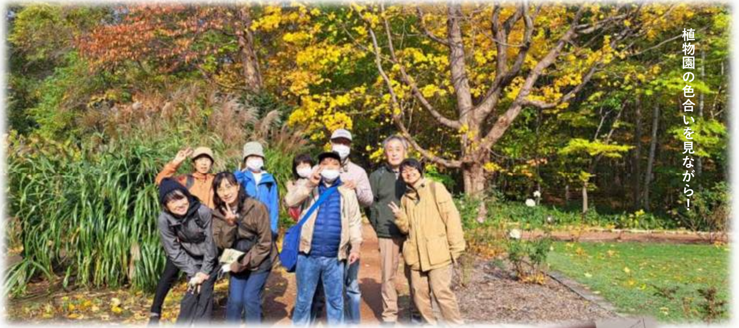
植物園の色合いを見ながら！