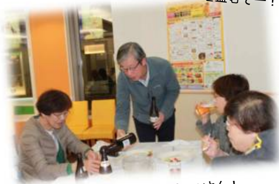
こまめにビールを継ぐ、来賓のYさん！