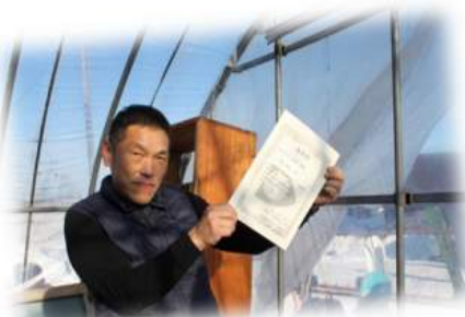
ビニールハウスで行われた表彰式！

採点！9時からスタート、どんどん滑って進行され、なんだかいつもの滑りより皆さんの滑りはスピード感、積極性がアップしてました。