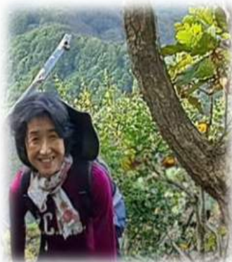
昨年10月シリパ山にて！

小中高は学校や父親と。大学、OLの頃は“私をスキーに連れてって”世代。秘密に「60才からのスキー」を計画中にSSFを知る事に。